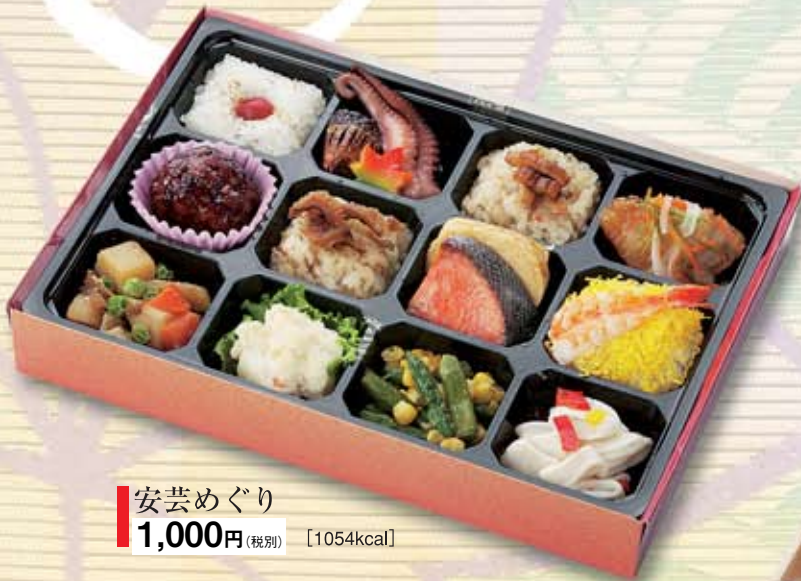
安芸めぐり 1,000円(税別) [1054kcal]