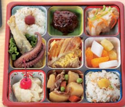
広島づくし弁当 700円(税別) [884kcal]