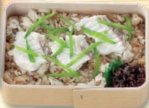
鯛づくし弁当 800円(税別) [494kcal]