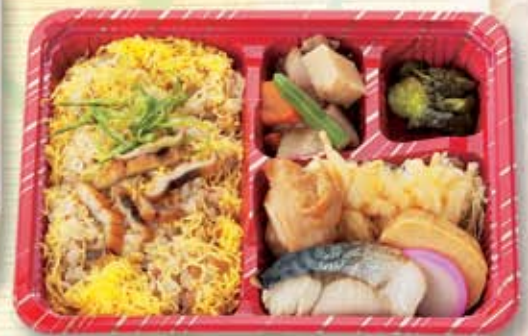
穴子飯弁当 600円(税別) [743kcal]