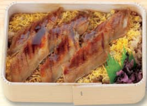
穴子づくし弁当 800円(税別) [797kcal]