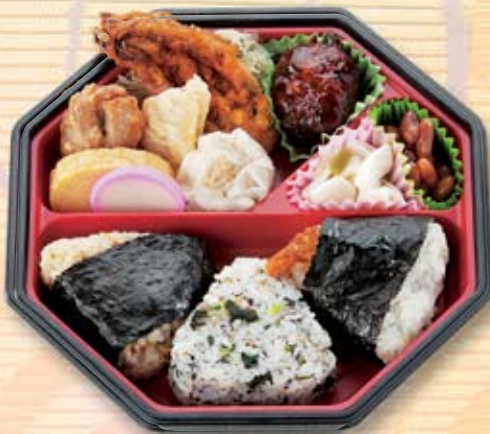
安芸むすび弁当 900円(税別) [826kcal]